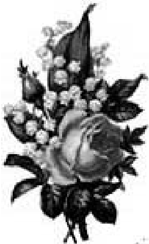
Дочь, зять, внучки.

О душе открытой, благородной – Ты не кривишь ею никогда Будь же счастлива родная наша Долгие – предолгие года!